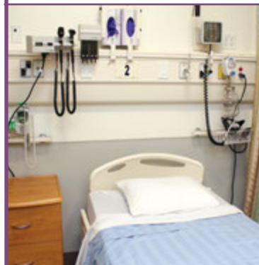
Salle de soins

Il y a toujours beaucoup de monde aux urgences. La plupart des patients doivent attendre dans les salles d'attente et les salles de soins.