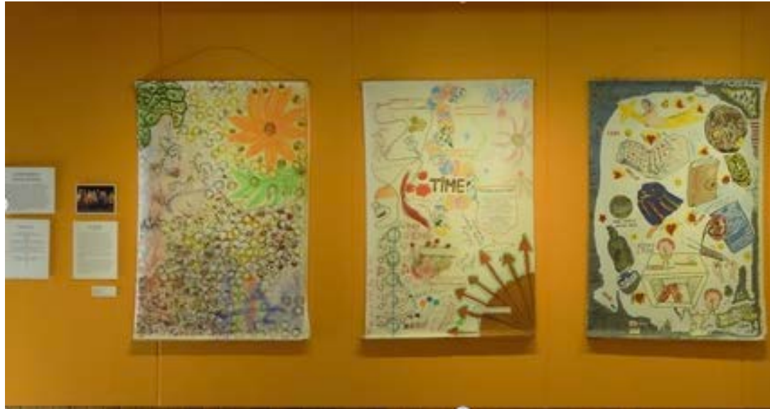
Trois toiles d'ainés en santé, fervents de la création artistique

Du 4 au 27 juillet 2014, nous avons célébré le 10 e anniversaire de notre Society for the Arts in Dementia Care (Société d'art-thérapie Alzheimer), à la galerie Ferry Building de Vancouver-Ouest (C.-B.), avec l'aimable soutien du Programme de recherche de la Société Alzheimer et de la West Vancouver Community Foundation . Pendant trois semaines, nous avons présenté les plus belles toiles de notre collection permanente, commencée il y a plusieurs années grâce à l'aide de la Société Alzheimer du Canada.