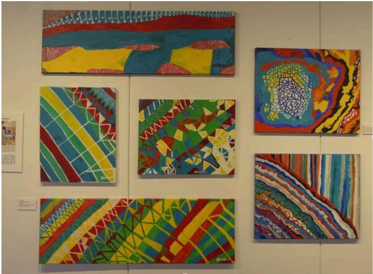
Tableaux du Centre de soins George Derby à la galerie Ferry Building

La galerie a accueilli plus de 2 500 visiteurs pendant les trois semaines de l'exposition. Ces visiteurs étaient assoiffés de bonnes nouvelles sur leurs parents et amis atteints de l'Alzheimer ou d'une maladie apparentée. Ils avaient besoin de savoir que les personnes qu'ils aimaient étaient toujours en mesure d'apprécier la vie, aussi longtemps que possible, malgré leurs aptitudes limitées. Le livre des visiteurs était rempli de commentaires élogieux et de félicitations. L'exposition et les conférences étaient offertes gratuitement. Au nombre des visiteurs, mentionnons des professionnels de la santé, des aidants, des personnes âgées atteintes de l'Alzheimer ou d'une maladie apparentée, des employés municipaux et des conseillers de district.